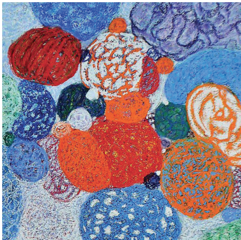
Omdat hij het niet zozeer over afbeeldingen wil hebben, beperkt de artiest zich tot het abstracte.